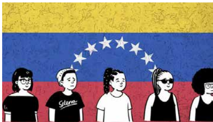
A propósito del #8M una adolescente venezolana da testimonio de su vida en el Perú. (Fotocomposición: El Comercio)