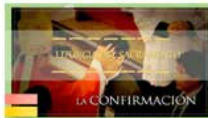
Libertad del sacramento de la Confirmación - 2014