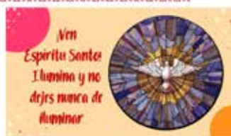
Oración al Espíritu Santo, 2019

Motivación - Ver - Juzgar - Actuar - Revisar - Celebrar