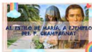
Al estilo de María a ejemplo del P. Champagnat, 2019