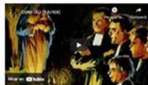
Mirar en YouTube

Motivación - Ver - Juzgar - Actuar - Revisar - Celebrar