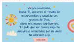
Oración - Corazón - Nuestra Señora Reina de los Reyes 2019